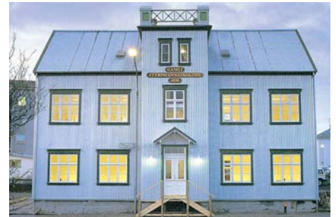
Húsnæði skólans að Öldugötu 23.

Sími: 580-1800 Fax: 580-1811 www.mimir.is