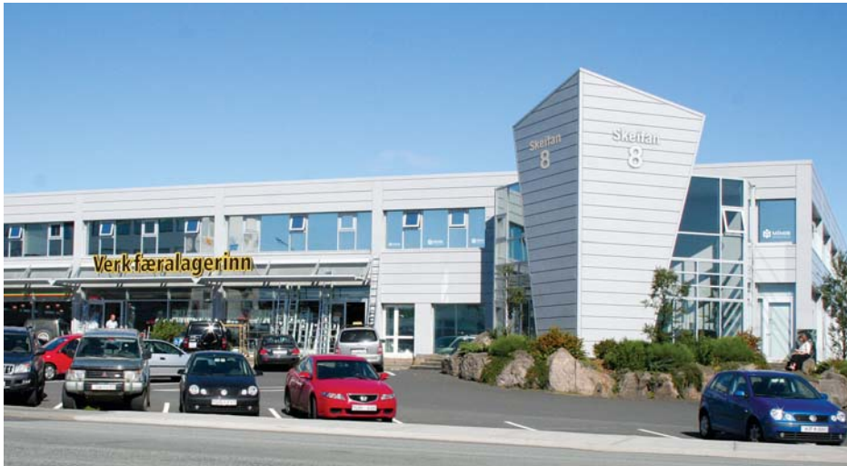
Skrifstofa Mímir-símenntunar og aðalkennslustaður er í Skeifunni 8.

Mímir-símenntun er fræðslufyrirtæki sem skipuleggur nám fyrir einstaklinga og aðila vinnumarkaðarins. Í þessum bæklingi er yfirlit yfir þau námskeið sem fólki gefst tækifæri á að sækja á vorönn 2008.