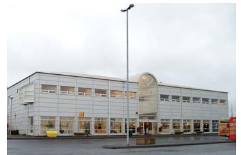
Kvöldnámskeið í íslensku fyrir útlendinga eru m.a. á 2. hæð í húsnæði Námsflokka Reykjavíkur við Pönglabakka 4.