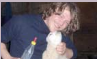
Husdyrnæring s 14