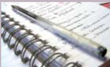
Sertifiseringskurs s. 11