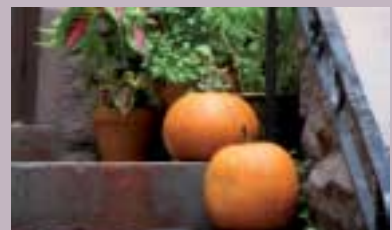
Hage - Hobby - Livsstil s. 24