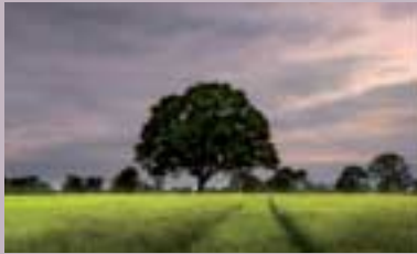
BSF - voksenopplæring i bygda s. 3