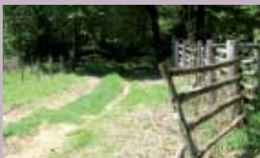
Næringsutvikling - Økonomi - Jus s. 9