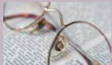
Litteraturkurs s. 26