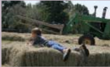
Landbrukets HMS-skole s 12