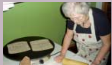
Mat - Drikke s. 23