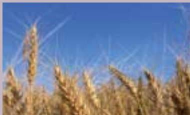
Jordbruk s 13