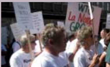
Organisasjon - Ploittikk - Samfunn s. 7