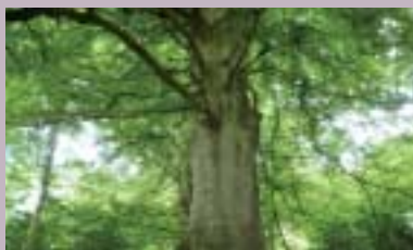
Skogbruk - Utmark s 19