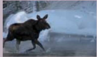
Jakt - Viltforvaltning s. 20