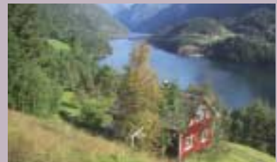
Bygdeliv - Kultur - Tradisjon s. 22