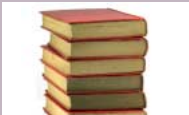
Pedagogikk - Studieveiledning s. 5