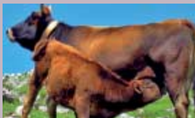
Studieretning for naturbruk s 18